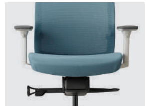
MECANISMO TILT-PRO CON MULTI BLOQUEO