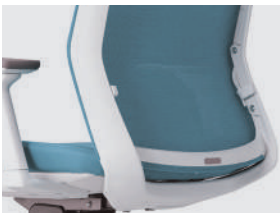
RESPALDO DE MESH CON AJUSTE DE TENSIÓN LUMBAR