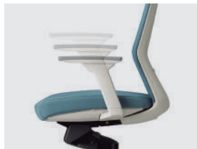
APOYABRAZOS REGULABLES CON SOFT PAD