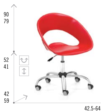
Modelo ONE NEUMÁTICA