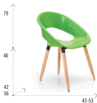
Modelo ONE WOOD